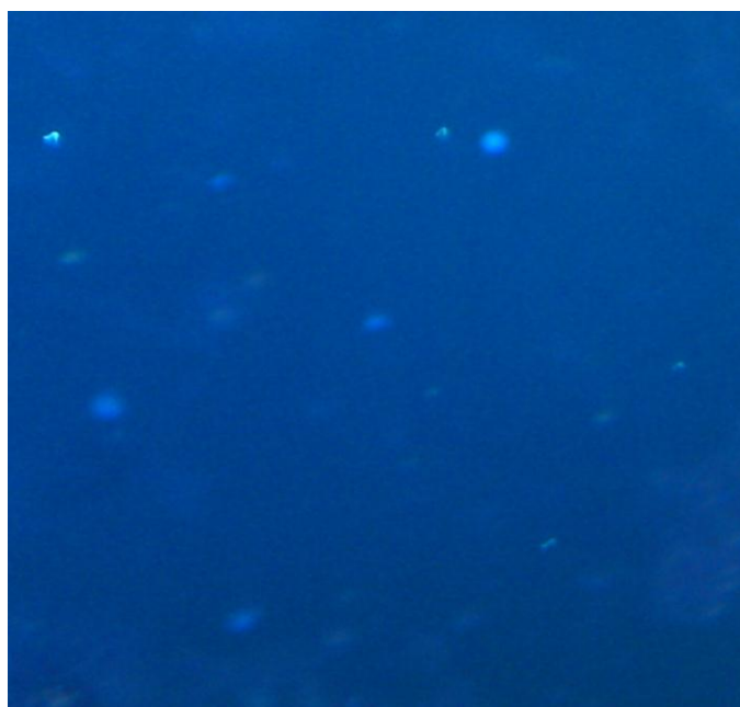
میکروسپوریدیوم در رنگ آمیزی کالکوفلور سفید

نیست و مرحله سافرائین آن حذف شده است سپس بلافاصله رنگ آمیزی کروموتروپ شروع می شود به این صورت که ابتدا لام ها را به مدت حداقل ۱ دقیقه در رنگ کروموتروپ گرم شده در دمای ۵۰ تا ۵۵ درجه سانتی گراد قرار داده و سپس برای رنگ بری ۱ تا ۳ ثانیه در اسید الکل ۹۰ درصد و به مدت ۳۰ ثانیه در اتانول ۹۵ درصد قرار داده می شود. در نهایت نمونه ها را در اتانول مطلق به مدت ۳۰ ثانیه گذاشته شد. این کار ۲ بار و در ۲ ظرف جداگانه انجام می گرفت. در این رنگ آمیزی اسپورهای میکروسپوریدیا به رنگ قرمز - قهوه ای دیده می شود و دارای ۲ وجه