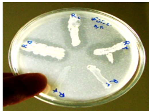
شکل ۱- نمونه ای از باکتری های کیتیناز مثبت روی محیط (CCA)

منبع کربن و انرژی است، کشت داده در دمای ۳۰ درجه سانتیگراد قرار داده شد (۱۰). کلونی هایی که هاله عدم رشد در اطراف آنها مشاهده می شد، از لحاظ باسیلوس بودن مورد ارزیابی میکروسکوپی و میکروسکوپی قرار می گرفتند. برای شناسایی باکتری ها مشکوک به باسیلوس از آزمایش های بیوشیمیایی استفاده گردید (جدول ۱) و برای شناسایی دقیق تر سویه های باکتری ها DNA آنها بوسیله کیت شرکت سیناژن استخراج و برای تعیین توالی به شرکت ماکروژن کره ارسال گردید (جدول ۲). برای ارزیابی فعالیت ضد قارچی باسیلوس های کیتیناز مثبت، نمونه های قارچی Aspergillus niger (ATCC 10231) Aspergillus flavus (ATCC 2029) Candida albicans (PTCC 5004) Alternaria alternata (PTCC 5115) Fusarium oxysporum (PTCC 5224) از سازمان پژوهش های علمی صنعتی ایران تهیه گردید. برای تهیه سوسپانسیون باکتریایی از باکتری های رشد یافته (کشت خالص) در محیط اختصاصی آگار دار استفاده شد. یک تا دو کلنی از باکتری مورد نظر به محیط برات که رشد میکروارگانسیم را حمایت کند تلقیح نموده و محیط های برات حاوی